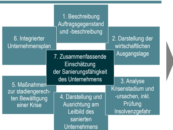
Bestandteile eines Sanierungskonzeptes nach IDW S6